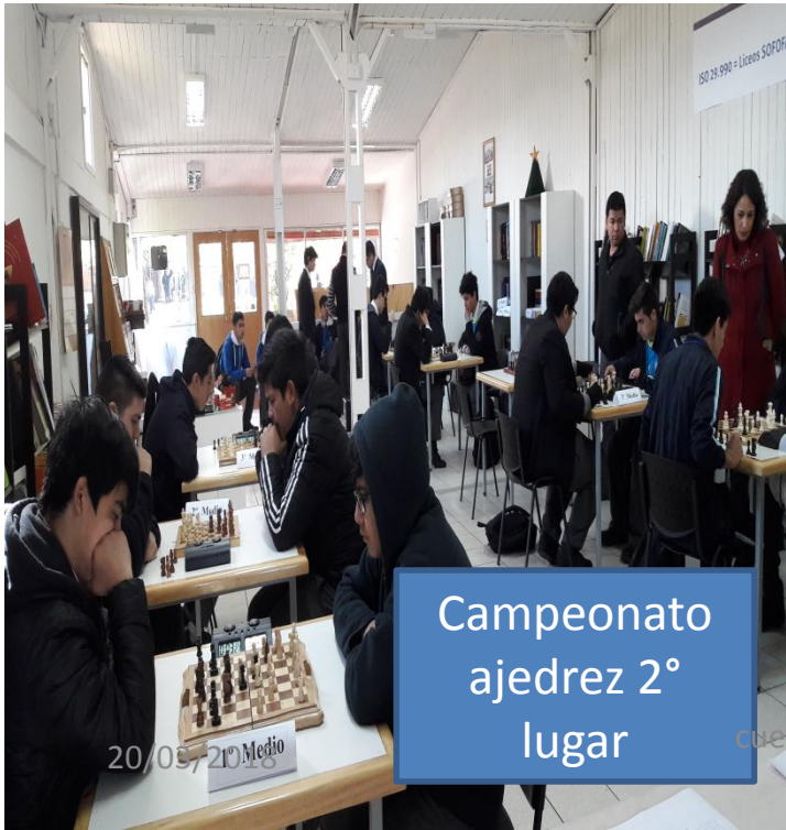
Campeonato ajedrez 2° lugar